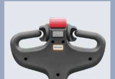
Die Funktion zum Aufrichten der Pinne ermöglicht es, auf engstem Raum, z. B. in Containern, zu arbeiten