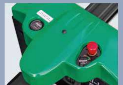
Der Körper zeichnet sich durch glatte Linien und ein reiches Bewegungsgefühl sowie ein kompaktes Profil aus, das dem neuesten Design-Trend entspricht