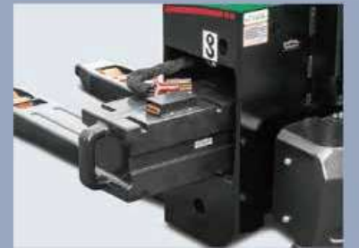
Einfach zum Batteriewechsel