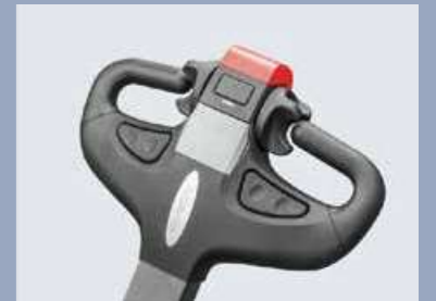
Die modulare Pinne ist einfach, schön und zuverlässig, alle Teile im Inneren können separat ausgetauscht werden