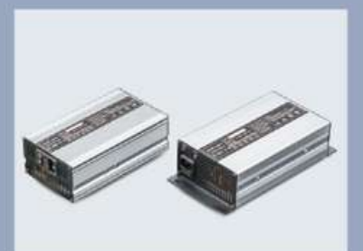
Das Ladegerät hat einen kompakten Körper und ist leicht zu tragen